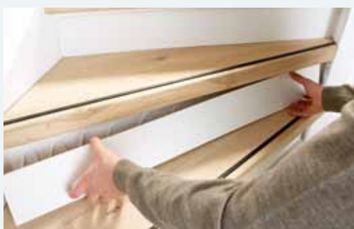
8. Stootborden monteren