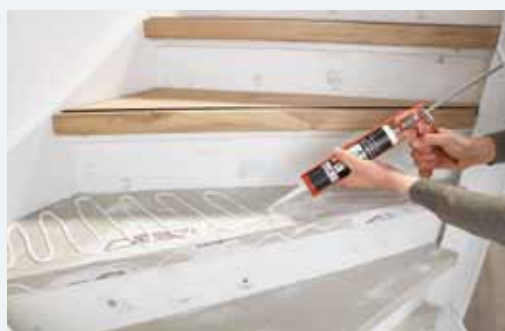
7. Monteren van de overzettreden met montagekit