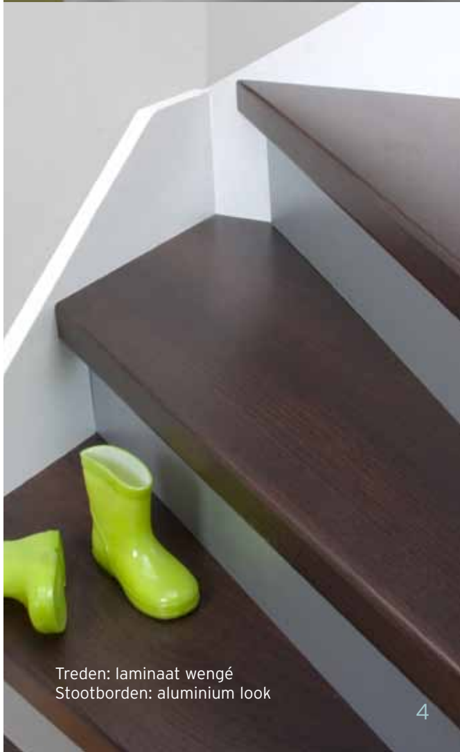
Treden: laminaat wengé Stootborden: aluminium look