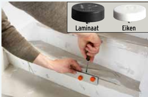
1. Plaats de trapspin met de juiste afstandhouders op de oude trede en zet deze met twee schroeven vast