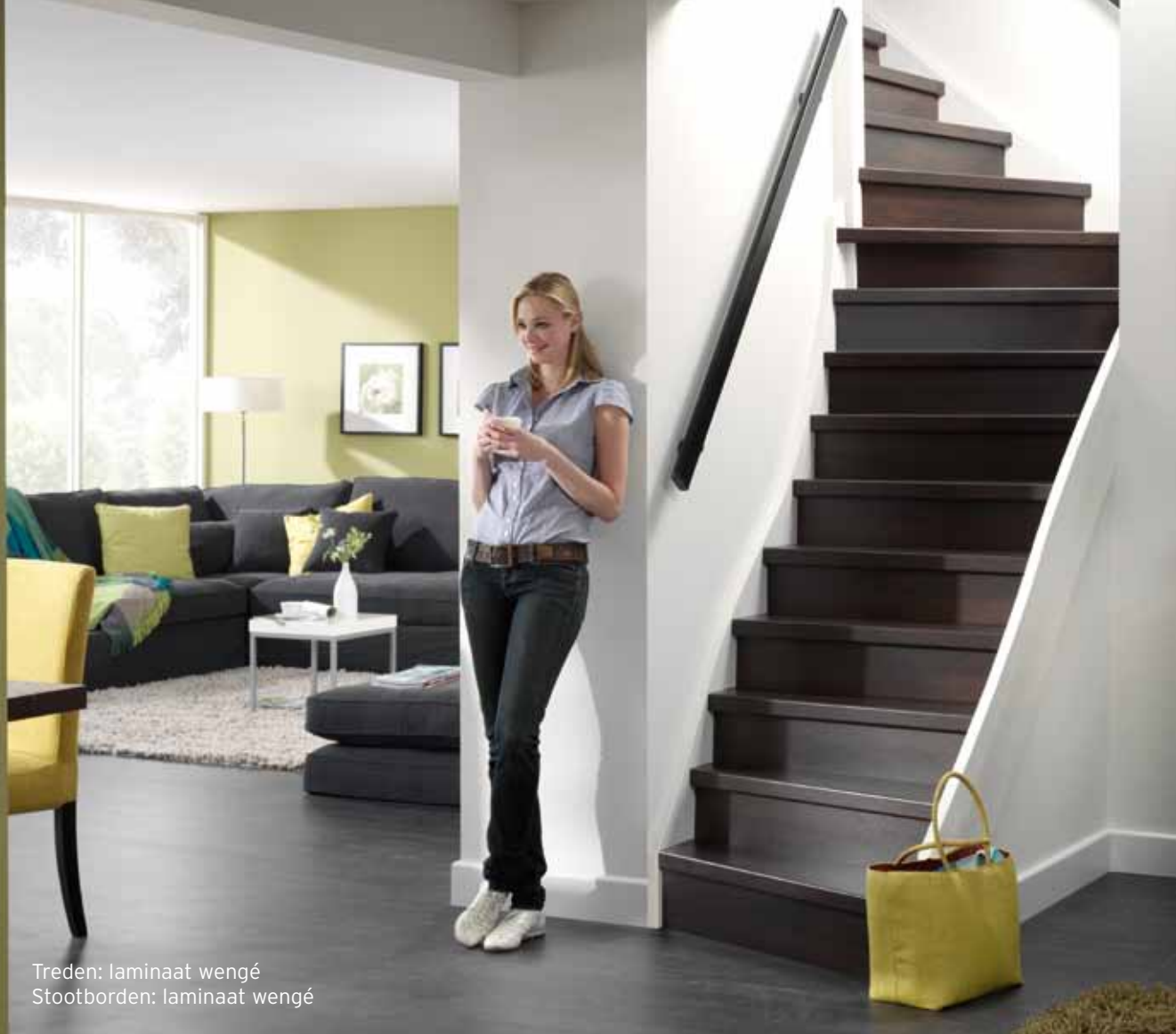
Treden: laminaat wengé Stootborden: laminaat wengé