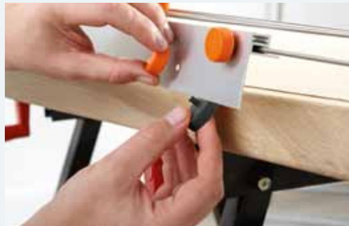
3b. Verwijderen van de afstandhouders (zwart 12 mm)*