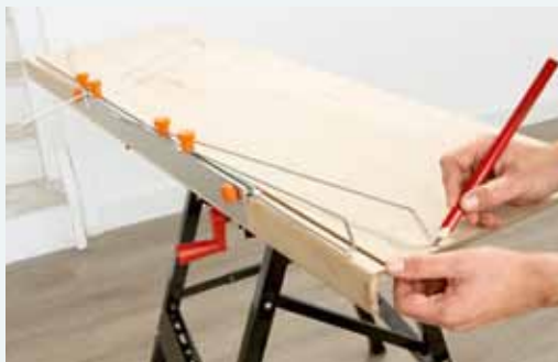
4. Aftekenen van overzettreden door punten te zetten en deze met elkaar te verbinden