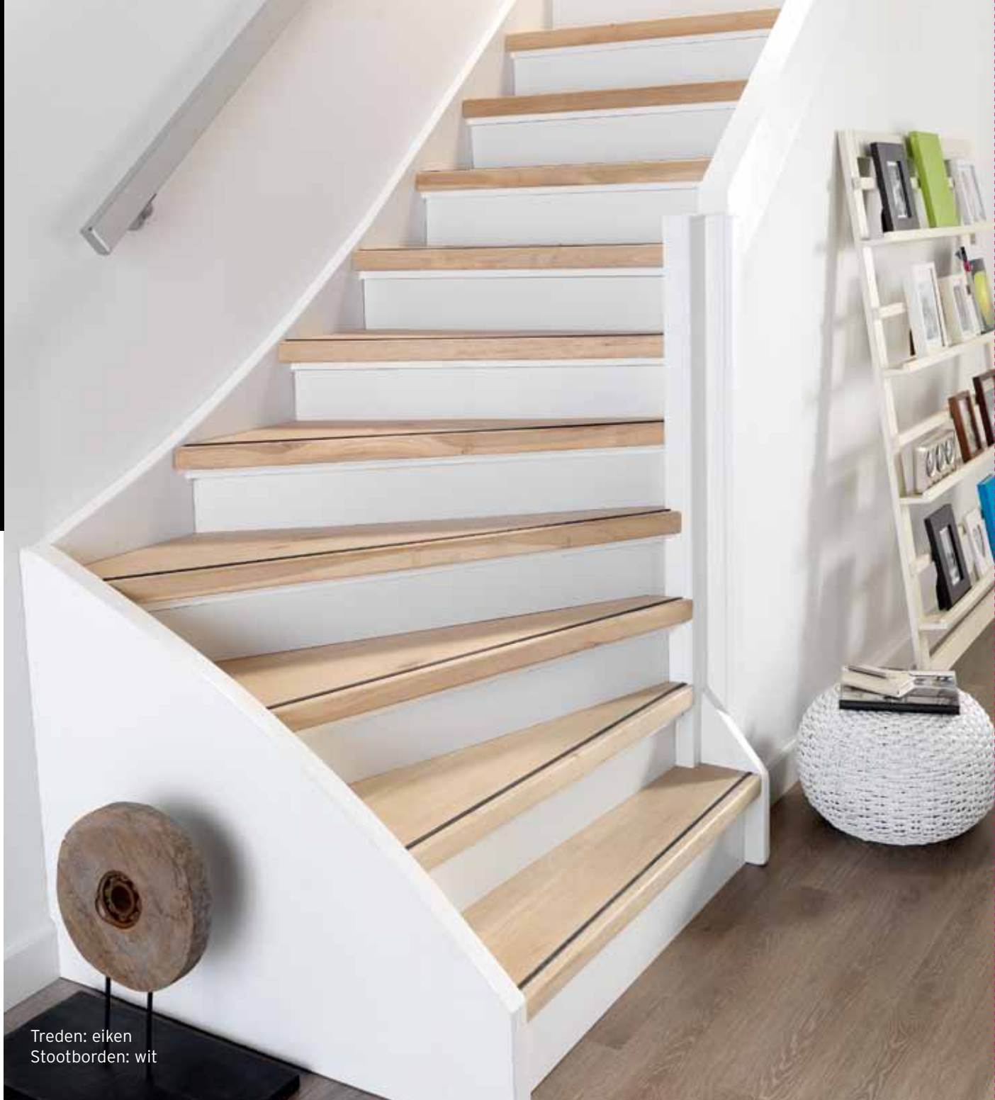
Treden: eiken Stootborden: wit