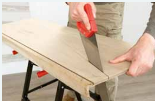
5. Op maat zagen van de overzettreden