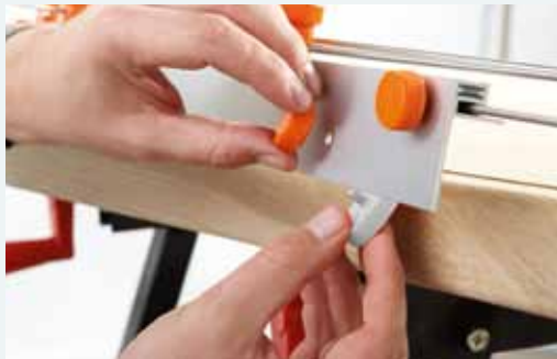
3a. Verwijderen van de afstandhouders (wit 9 mm)*