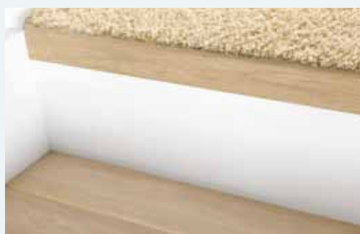
9. Afwerken met de afwerkljst