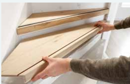
6. Controleren of de trede past