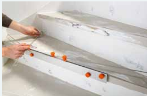
2. Inmeten oude trap treden met trapspin door de uitschuifpennen in elke hoek te plaatsen