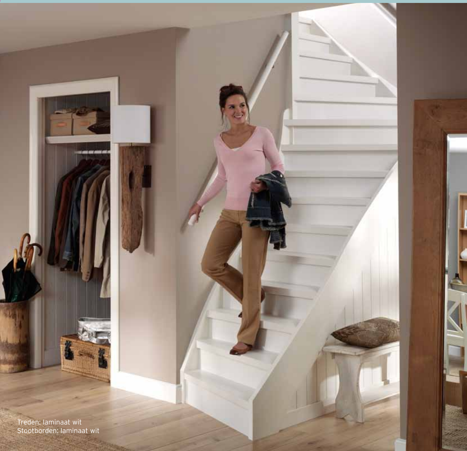
Treden: laminaat wit Stootborden: laminaat wit

De eiken treden kunnen geheel naar eigen smaak en in elke gewenste kleur afgewerkt worden. Of u kiest voor laminaattreden in een van de twee decoren wengé en wit. Uw trap is weer als nieuw!